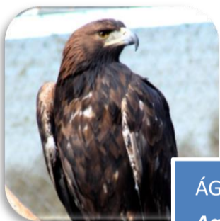
ÁGUILA REAL Aquila chrysaetos