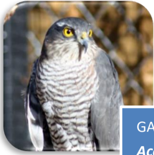
GAVILÁN Accipiter nissus