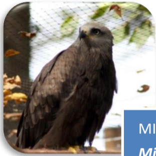
MILANO NEGRO Milvus migrans