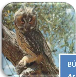
BÚHO CHICO Asio otus