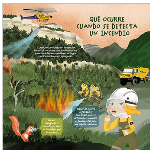
PANEL 4. TRASERA.