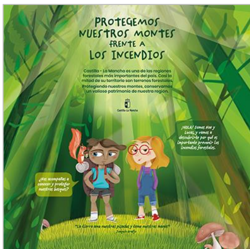
PANEL 1. FRONTAL.