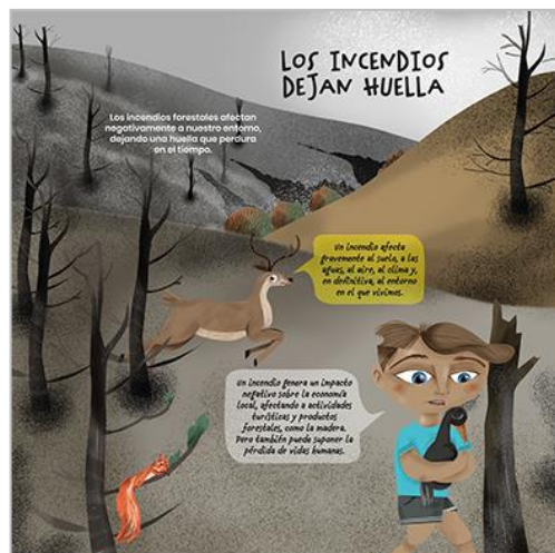
PANEL 2. TRASERA.