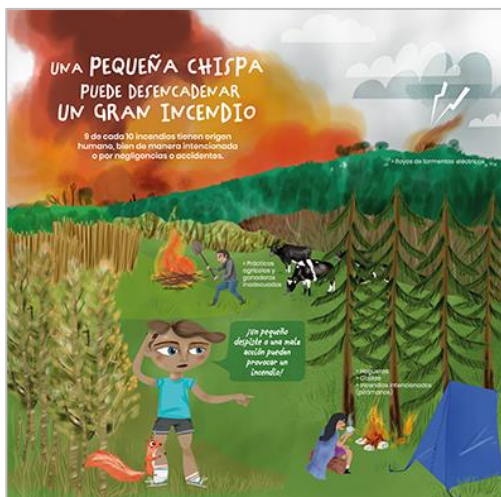
PANEL 2. FRONTAL.