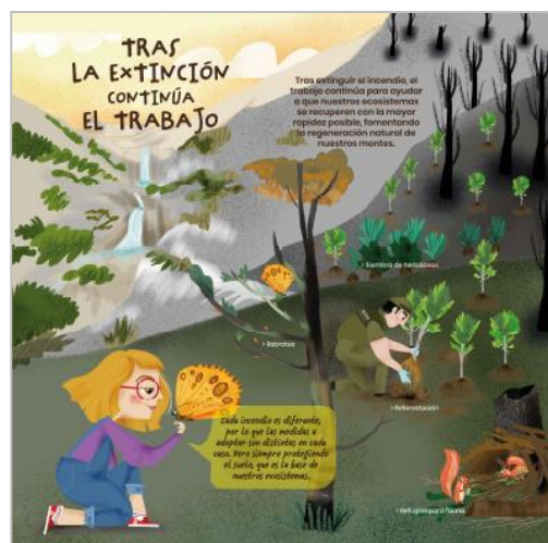
PANEL 5. FRONTAL.