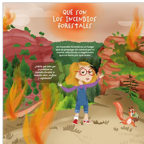
PANEL 1. TRASERA.