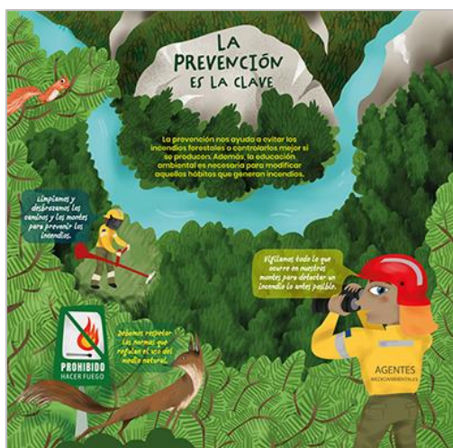
PANEL 4. FRONTAL.