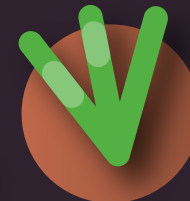
restos de poda y de jardinería domiciliarios