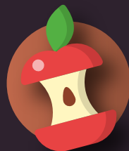
pieles y restos de fruta y verdura