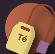
restos de café e infusiones