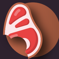
huesos y restos de carne