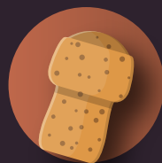
tapones de corcho y serrín