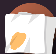
papel de cocina, pañuelos y servilletas sucios