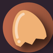
cáscaras de huevo y de frutos secos