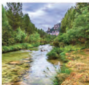
Vista Río Tajo

El alto grado de naturalidad de este territorio, ha configurado paisajes singulares y de espectacular belleza. ■