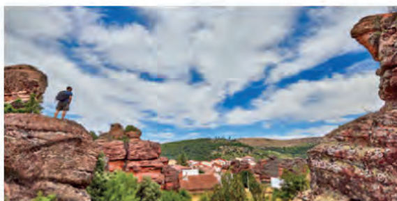
Vista de Chequilla.